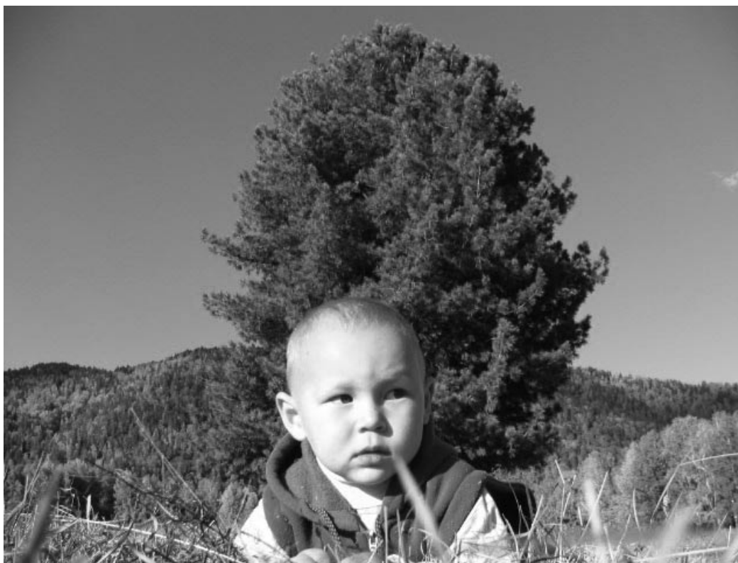
Правнук Деда Альчи под защитой кедра и Торота.