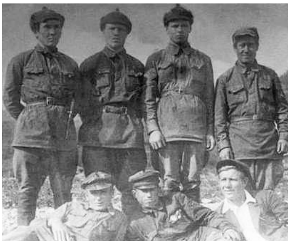
Наблюдатели Алтайского заповедника. Яйлю, 1937 г.