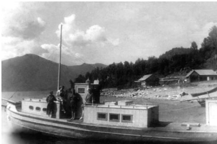
Первый пароход на Телецком озере «Шеф», («Св. Иннокентий», «Партизан»).