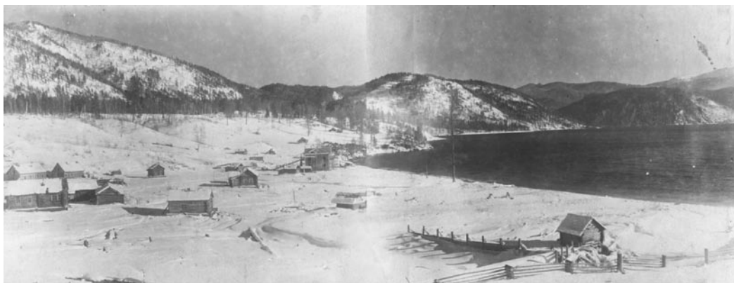
Яйлю, 1936 г.